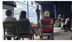
De acteurs van het theaterspektakel Boer Koekoek oefenen op locatie

Wouter Westerveld 14 juli, 12:37 • 2 minuten leestijd