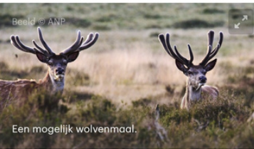
Een mogelijk wolvenmaal.