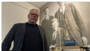
Met de subsidie wil het museum verder uitbreiden

Wouter Westerveld 4 juli, 12:00 • 3 minuten leestijd