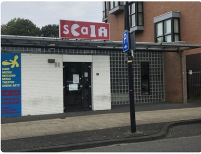
Het pand van Scala aan de Markt in Hogeveen.

Leerlingen van het voormalige Scala in Hogeveen kunnen in ieder geval tot aan de zomer weer buitenschoolse muziek-, dans-, theater- en cultuurlessen krijgen in het pand langs de Markt. Dat maakte wethouder Mark Tuit bekend tijdens de raadsvergadering vorige week.