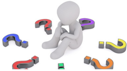
Hulp is soms moeilijk om te vragen.

Themabijeenkomst schuldhulpverlening #raad0528; in gesprek met externe (vrijwilligers)organisaties. Veel initiatieven, veel inzet, maar onderlinge samenwerking kan beter.