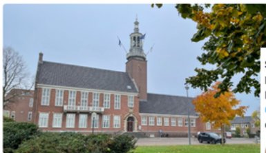
Geluid van jongeren moet beter hoorbaar worden in raadshuis Hoogeveen