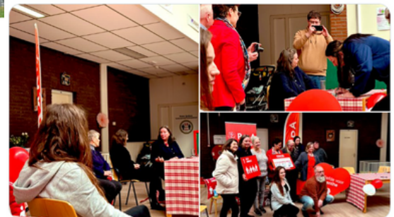
Bijeenkomst Sociëteit De Tamboer in gesprek over cultuur

In #Coevorden bij gesprek over armoede en bestaanszekerheid. Met o.a. Europarlementariër @a_jongerius en lijsttrekker @pvdadrenthe @YvonneTurenhout. Bijdragen ervaringsdeskundigen armoede maakten diepe indruk.